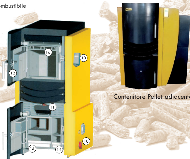
Contenitore Pellet adiacente